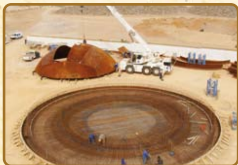
Etape 4 : Pose de dalle, ferrailage principal