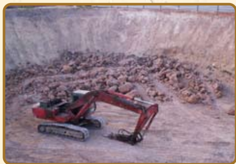
Etape 1 : Excavation à moins 11m