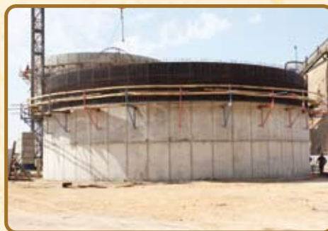
Etape 5 : Construction des sarcophages béton