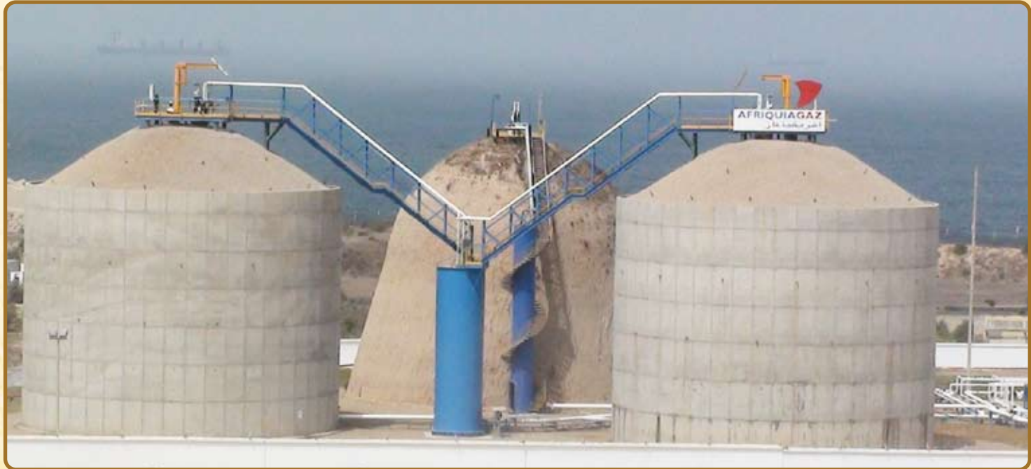
Schéma du Stockage