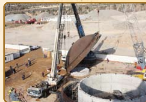
Etape 6 : Pose calotte inférieure sur jupe en béton