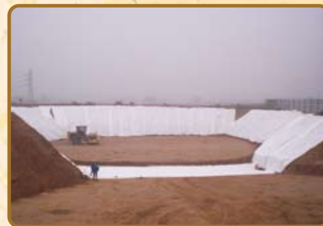
Etape 3 : Compactage : Pose de bidime antipollution