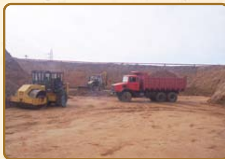
Etape 2 : Compactage : Reconstitution du sol