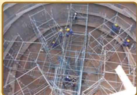
Etape 7 : Montage des sphères